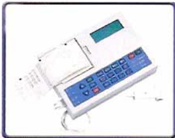
جهاز فحص كفاءة الرئة

للمزيد من المعلومات الاتصال على هاتف: ٥٦٦٦٢٧١ - ٥٦٨٦١٩٦ مديرية الصحة المهنية - الرعاية الصحية الأولية وزارة الصحة