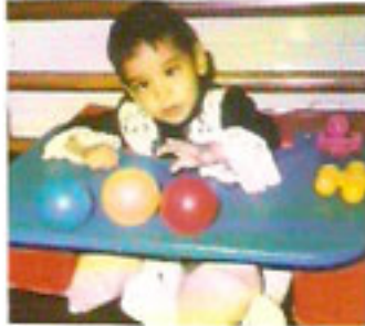
٤ - الجلوس في وضع مربع أمام طاولة في مستوى الطفل.