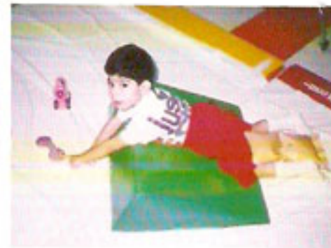
١ - الاستلقاء على البطن

وهناك اوضاع مختلفة يمكن ان يوضع بها الطفل اثناء لعبه: