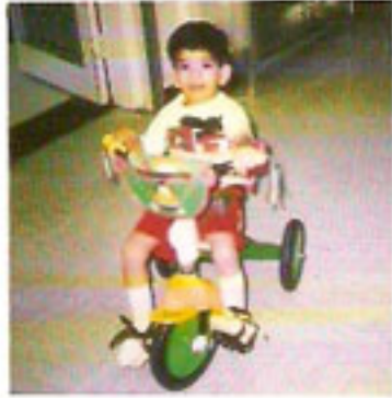
٥ - استخدام الدراجة مع استخدام حزام تثبيت الطفل وتثبيت القدم.