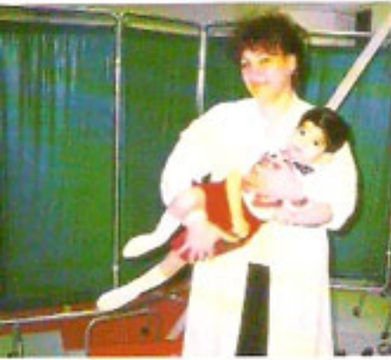
الطريقة السليمة لحمل الطفل.

يرجى مراعاة: حمل الطفل كما في الأشكال التالية: