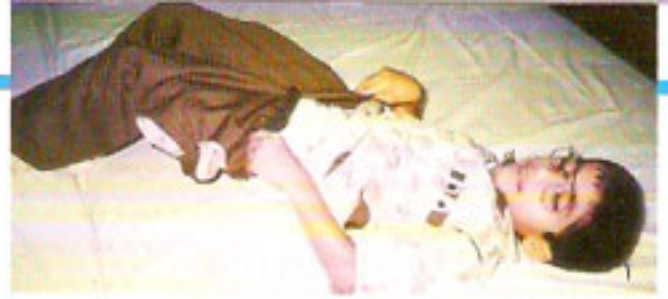
٢ - الاستلقاء على الجنب.