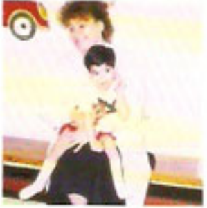
٣ - الجلوس في حضن الأم.