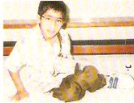
٢ - الطريقة السليمة لجلوس الطفل